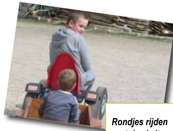
Rondjes rijden met de skelter